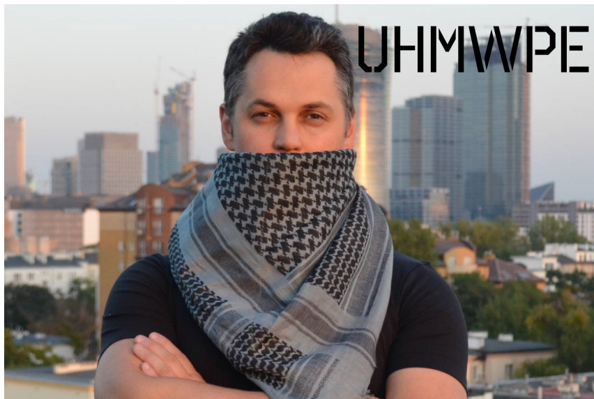
Warstwa Ochronna UHMWPE